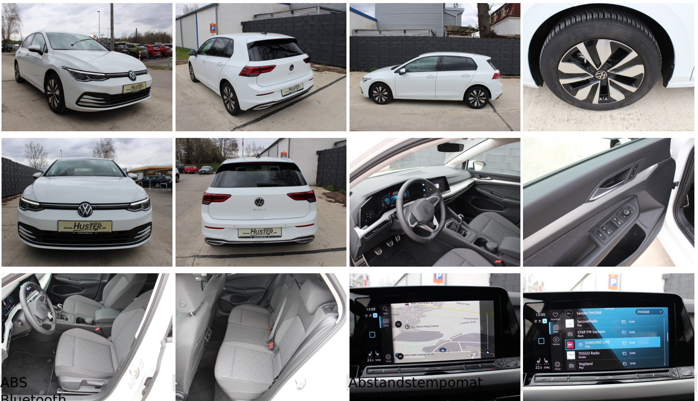
ABS Bluetooth ESP Einparkhilfe Sensoren hinten Abstandstempomat Bordcomputer Einparkhilfe Einparkhilfe Sensoren vorne