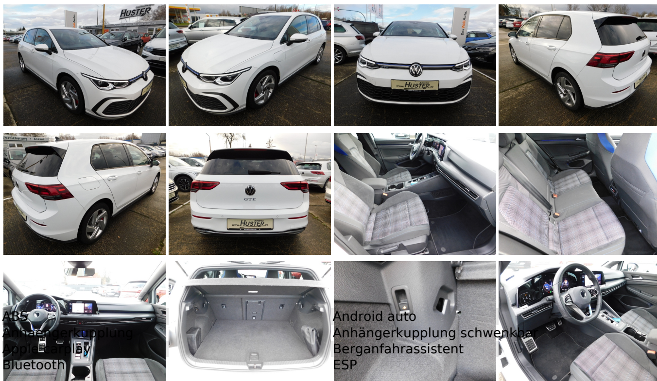
Android auto Anhängerkupplung schwenkbar Berganfahrassistent ESP