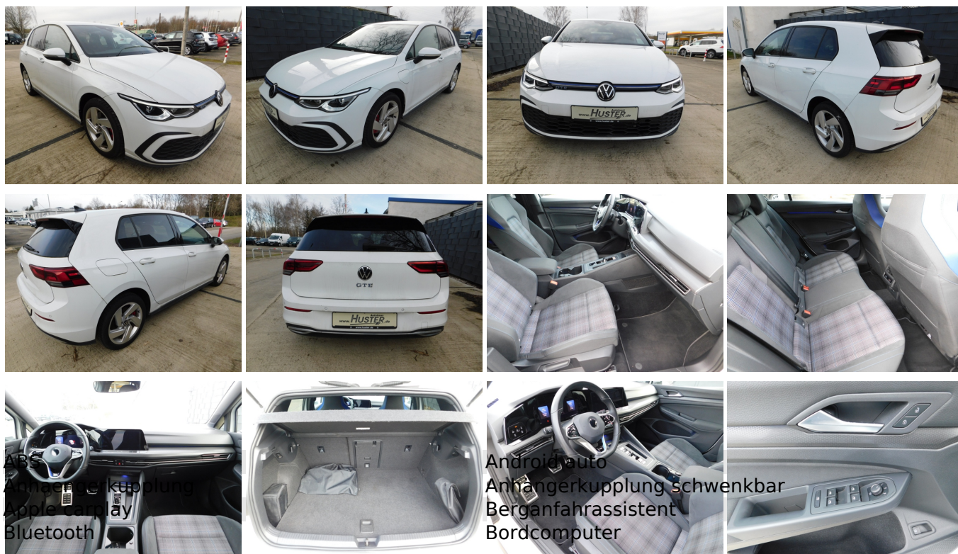
Android auto Anhängerkupplung schwenkbar Apple carplay Bluetooth