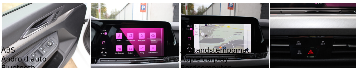
ABS Android auto Bluetooth Dachreling Abstandstempomat Apple carplay Bordcomputer ESP